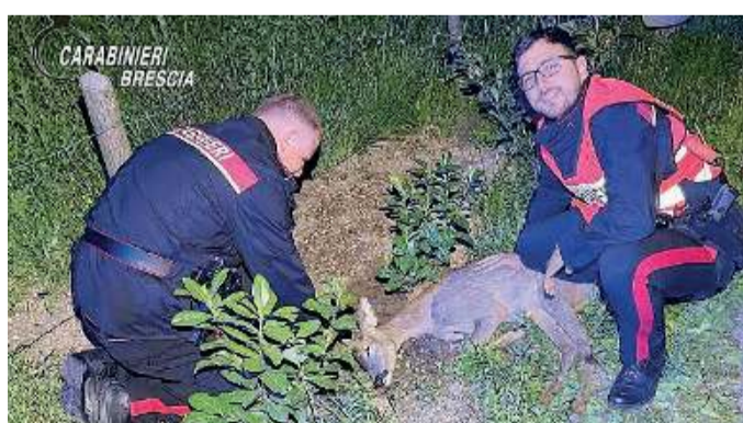
In Valsabbia. Due carabinieri con il capriolo ferito

I carabinieri hanno attivato il servizio veterinario locale, in attesa dell'arrivo della Polizia provinciale e di un veterinario reperibile, che ha preso in cari-