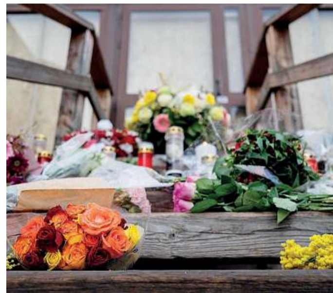
Cronaca. Riflessioni dopo i fatti di Crans-Montana e altri drammi