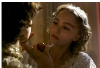
Martedì al Cinema Sociale: «Io danzerò» di Stéphanie Di Giusto

La debuttante regista Stéphanie Di Giusto ha così spiegato la nascita del film: «Tutto ha avuto inizio con la fotografia in bianco e nero di una ballerina che fluttuava nell'aria avvolta in un vortice di veli. La didascalia recitava: Loie Fuller: icona della Belle Époque. Ero curiosa di conoscere la storia della donna che si celava dietro a quei lunghi lembi di stoffa e ne sono rimasta sbalordita: mi affascinava il fatto che fosse diventata famosa nascondendosi e il suo spirito pionieristico. Grazie alla sua «danza ser-