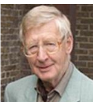
Peter Hurford: una vita di musica

Peter Hurford, che si avvia alla novantina, è stato un notissimo organista britannico e Decca gli dedica un «omaggio alla carriera» con ben 17 cd in cui esprime il meglio delle sue interpretazioni bachiane. Sono registrazioni comprese per la massima parte tra il 1974 e il 1982, ma arrivano al 1986 ad esempio con i Corali dalla Collezione Neumaster interpretati sull'organo bachiano di Vienna, nell'Augustinerkirche. La grande raccolta rappresenta non solo una splendida esplorazione non solo della letteratura bachiana per organo, ma anche di strumenti particolari e prestigiosi: come nel caso dei sei Concerti BWV 592-597 e dei Preludi Corali